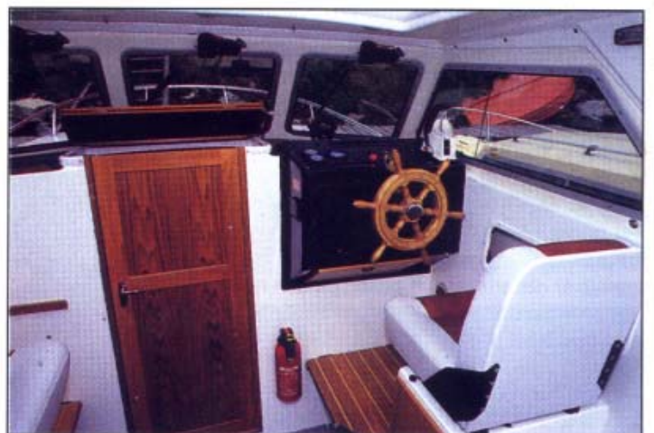
Førermiljøet har fått en ansiktsløfting. 70-modellen (til venstre) mangler passasjerseate, og førerstolen og instrumenteringen er nokså avlegs. Men det har holdt i 20 år og gjør fortsatt nytten sin.