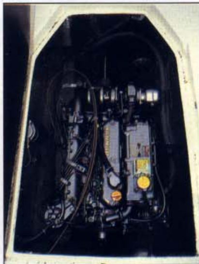
I 70-modellen (motoren til høyre) er den opprinnelige 25 hk tosylinderen fra Volvo Penta skiftet ut med en tresylindret 36 hk. I 90-modellen sitter en 60 hk Yanmar.