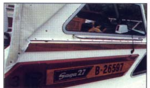
Båtmodellen het opprinnelig Sagatour 27, som du ser her på det originale dekkelet. Det nye dekkelet er blitt større, inkluderer lanternen og har den dyprøde Saga-fargen.