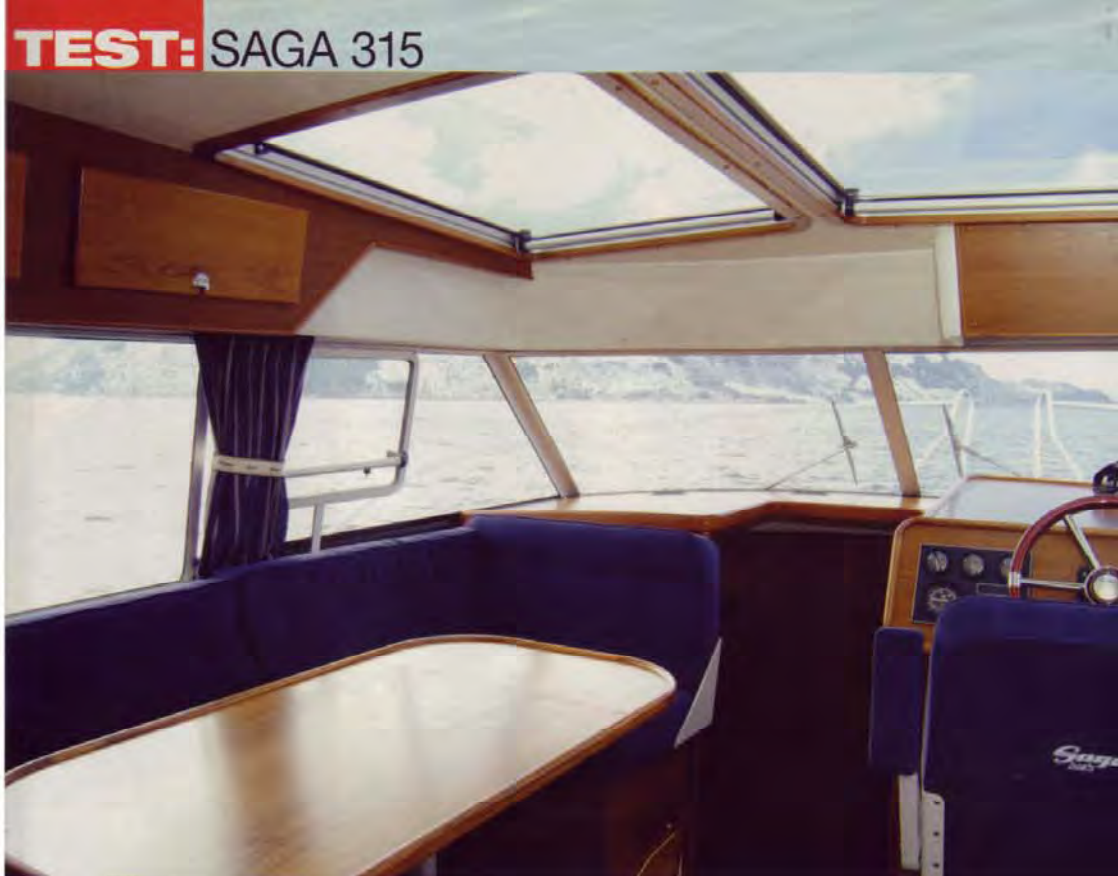
FLEKSIBEL salong. Pluss i boken for vendbart passasjer sete.

Vinduet både ved førerplass og passasjerplass kan åpnes. I tillegg kan begge taklucene (ekstrastrutyr) skyves akterover.