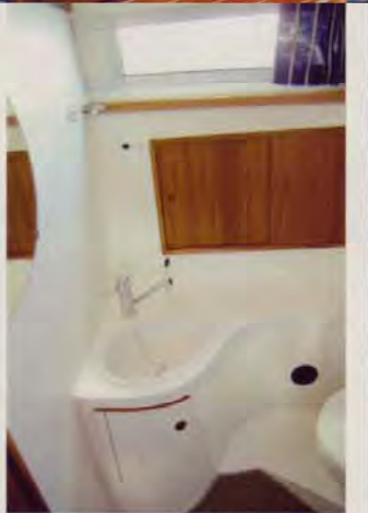
KVALITET: Toalettrommet fungerer bra, men kun unntaksvis til stor kroppsvask.

Rattet er stort og solid, og motorspaken er en ettgrepklassiker fra Morse som faller rett i hånden. I tillegg er det en sjalte-