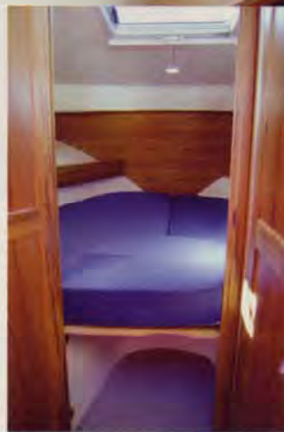
STOR KØYE og mye stuveplass i lugaren bidrar til langturkomfort.

Stikklugaren under dekk er en del av mellomgangen, med god skaplass og en liten sittebenk. Stikkøya er drøyt to meter lang og ca 115 cm bred - majestetisk plass for en, koselig for to. Skott og undersiden av dekket er polstret, men litt slurvete visse steder, hvor det blir vel mye elefanthud. Belysningen består av to lamper oppunder dekk, foruten et køyee som kan åpnes. Adkomsten til lugaren er god, og er ytterligere forbedret med et godt dimensjonert, rustfritt håndtak. I mellomgangen er det en skapmodul med mye bra stuveplass, blant annet et skikkelig hengeskapp. I tillegg er det noe stuveplass i